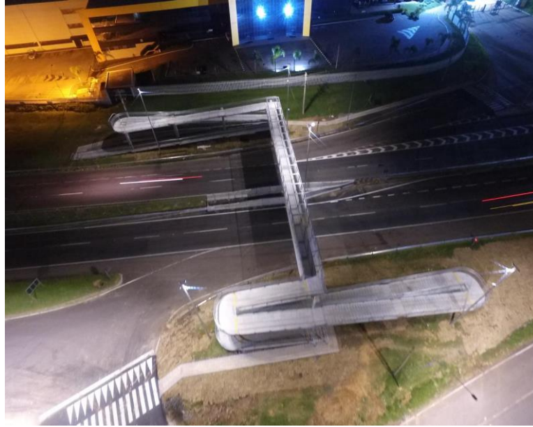
Vista geral da passarela km 437+800(SNV) km 436+000(PER).