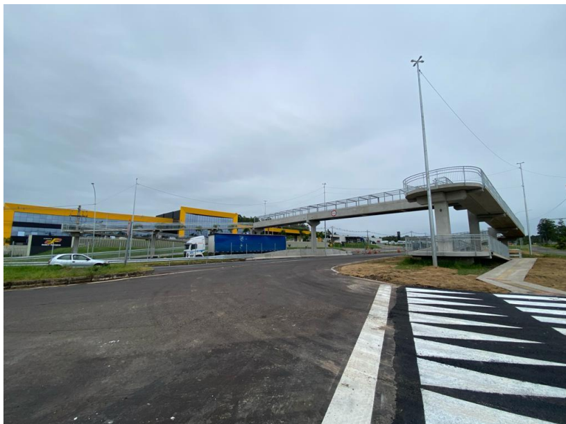
Vista geral da passarela km 437+800(SNV) km 436+000(PER).