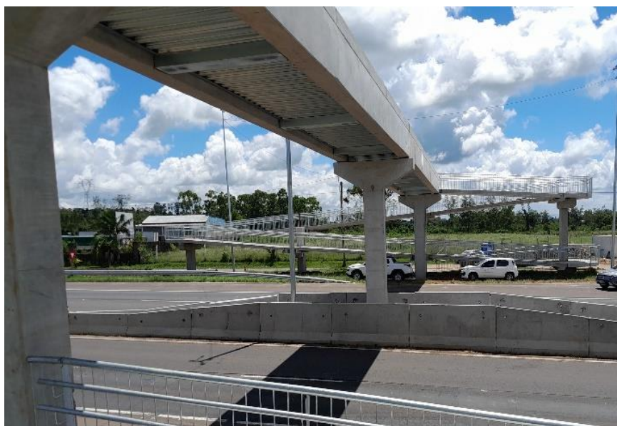
Vista geral da passarela km 437+800(SNV) km 436+000(PER).