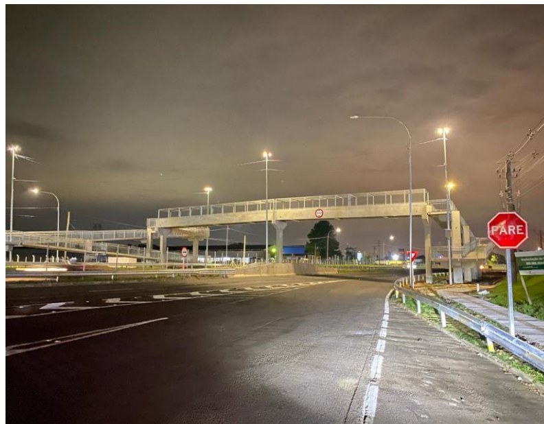
Vista geral da passarela km 437+800(SNV) km 436+000(PER).