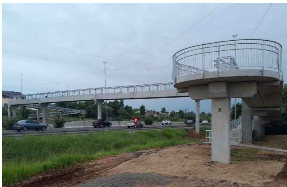
BR 290-Km 069+350 Pista Leste/Oeste.