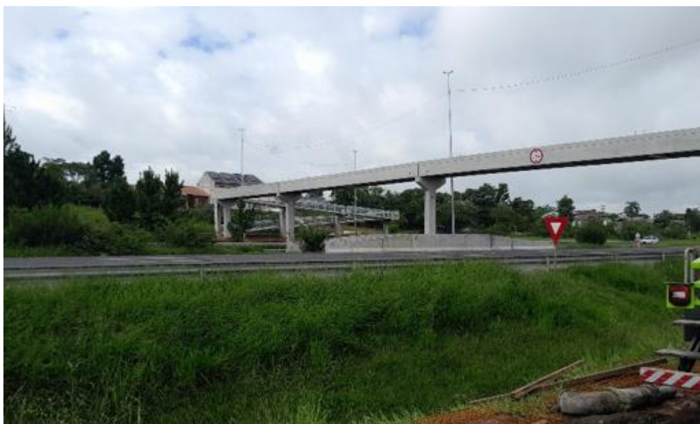
Figura 4 – Localização da obra