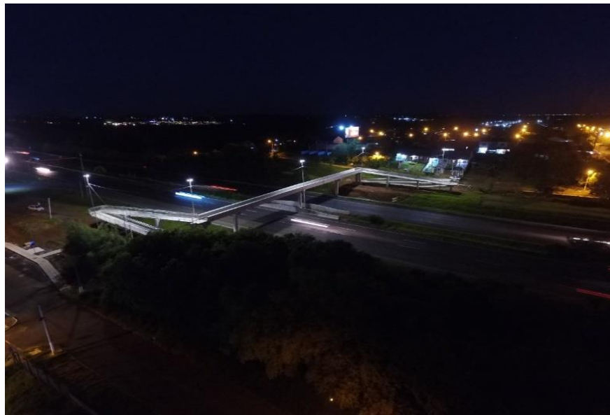
BR 290-km 069+350 Pista Leste/Oeste.