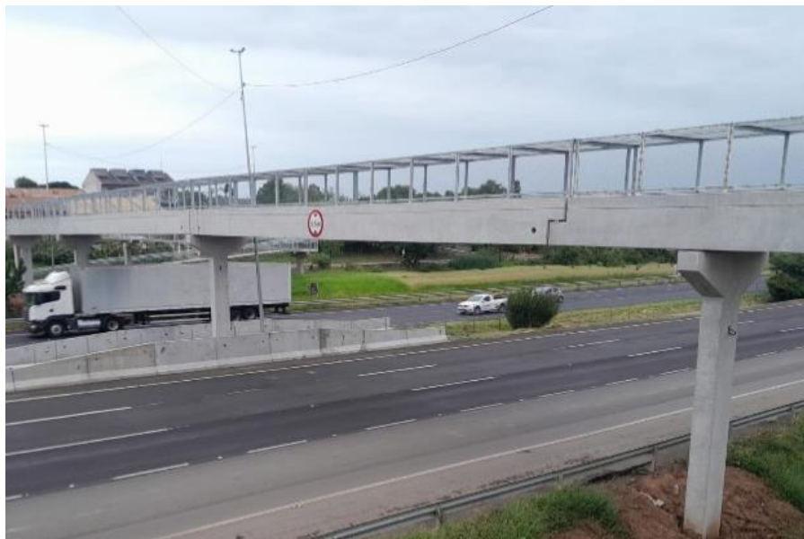
BR 290-Km 069+350 Pista Leste/Oeste.