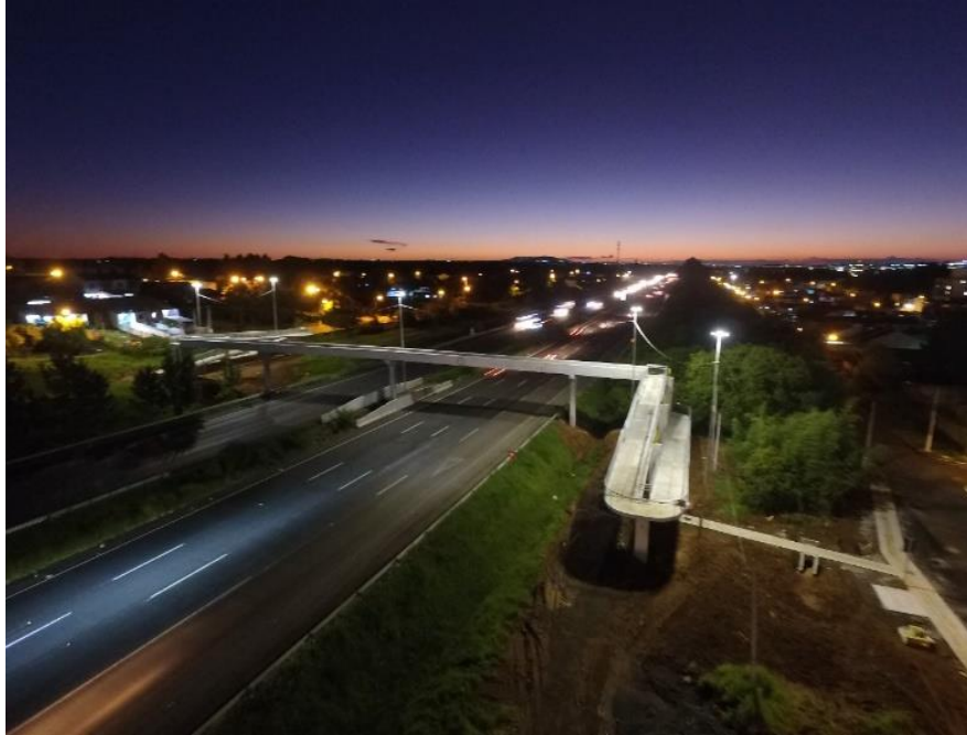
BR 290-km 069+350 Pista Leste/Oeste.