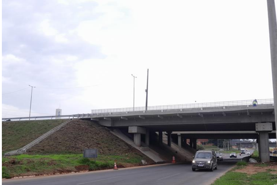
Vista frontal BR 290/RS-km 74+700.