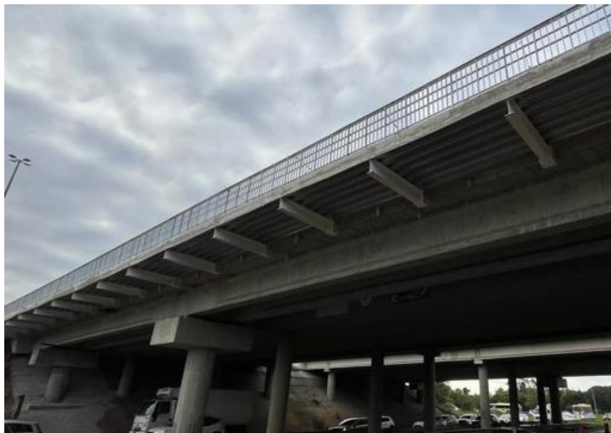
Vista inferior BR 290/RS-km 74+700.