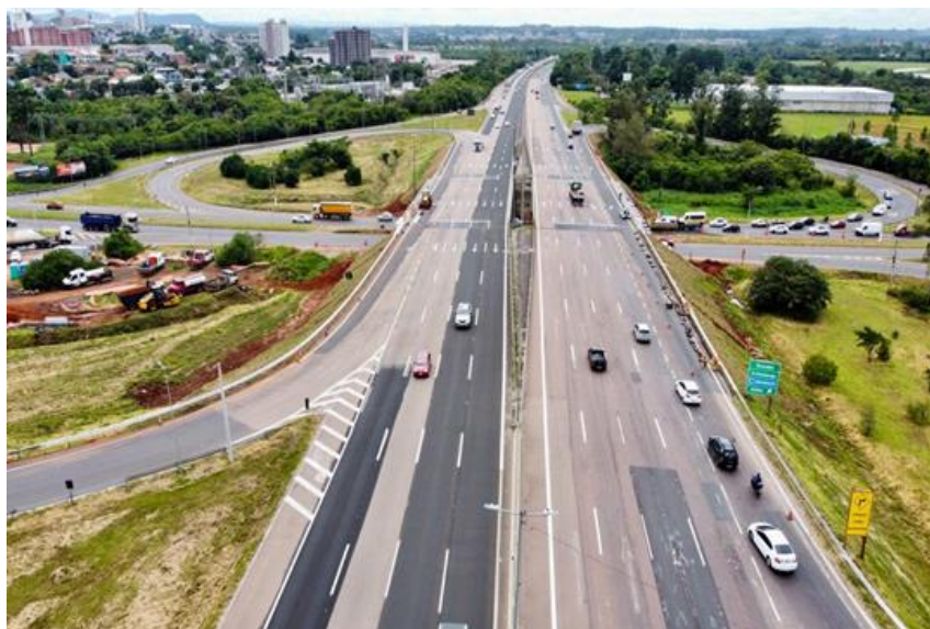
Vista Geral BR 290/RS- km 74+700.