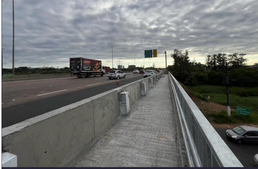
Vista superior da passagem BR 290/RS-km 74+700.