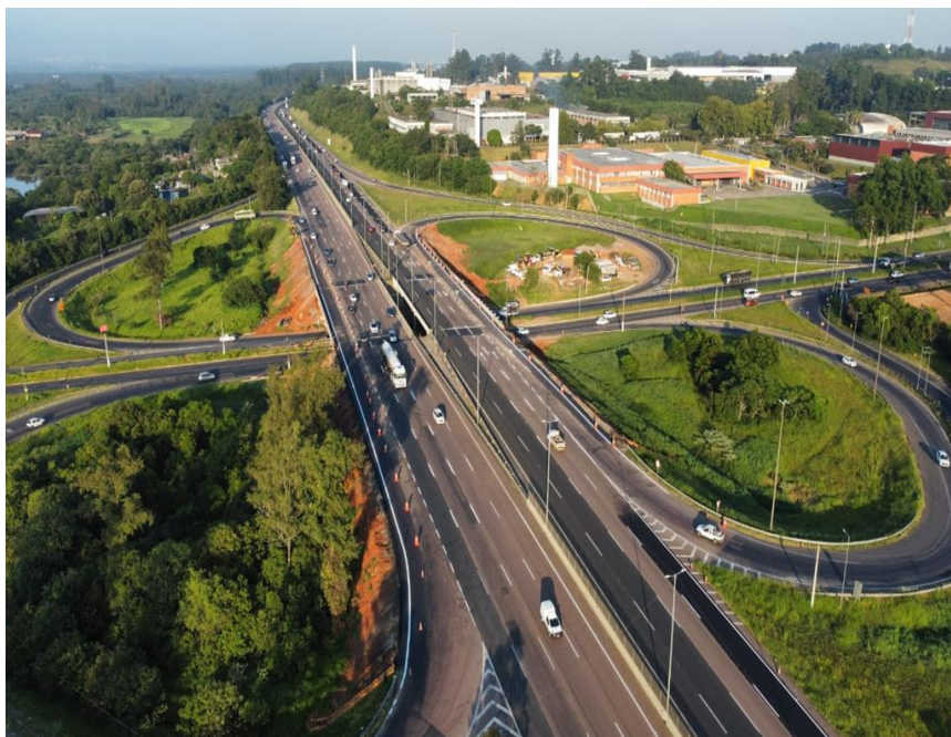
Vista superior BR 290/RS- km 74+700