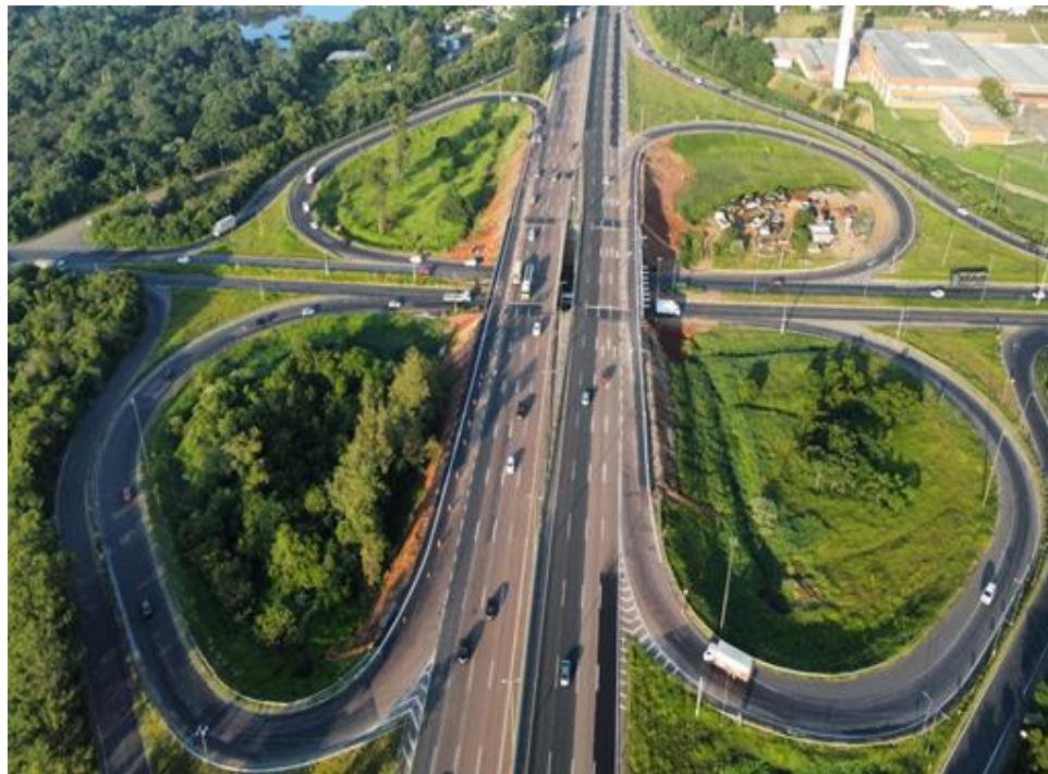
Figura 4 – Localização da obra