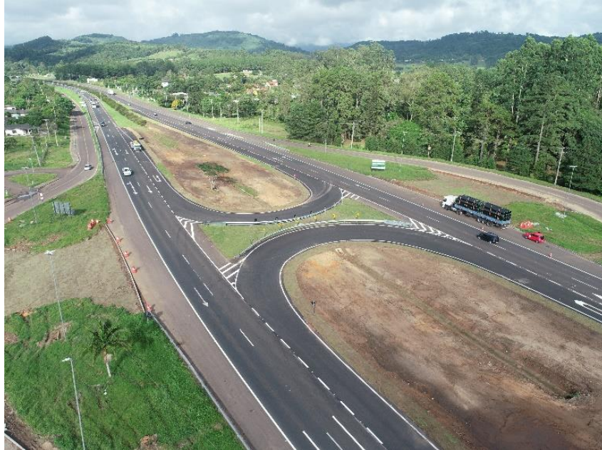
BR 101/RS km 009+570.