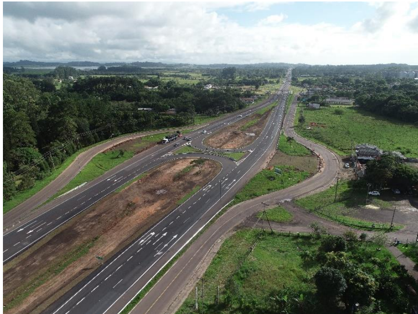
BR 101/RS km 009+570.