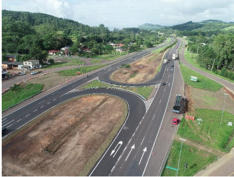
BR 101/RS km 009+570