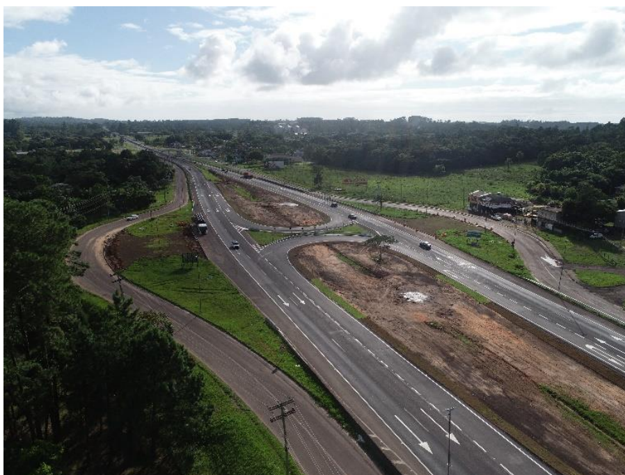
Figura 4 – Localização da obra