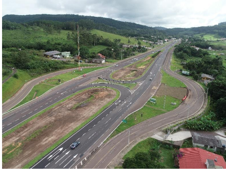
Vista geral da Reformulação BR 101/RS-km 019+360.