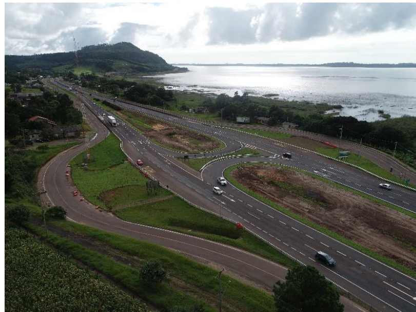
Figura 4 – Localização da obra