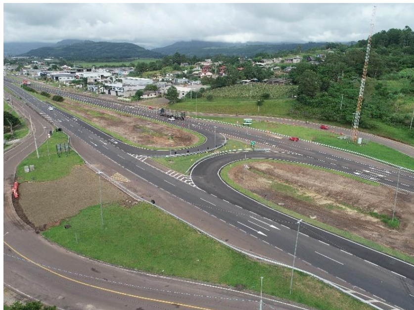
Vista geral da Reformulação BR 101/RS-km 019+360.