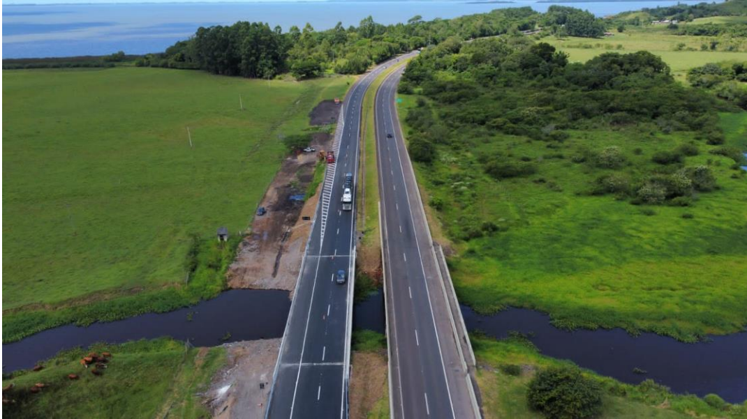
BR 101 km 052+930 N.