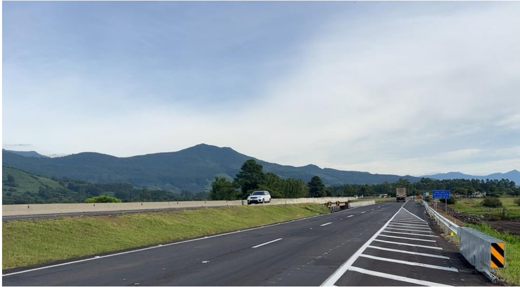
BR 101 km 052+930 N.