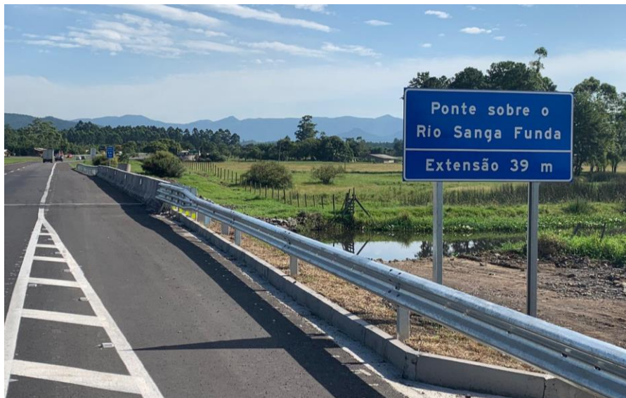
BR 101 km 052+930 N.