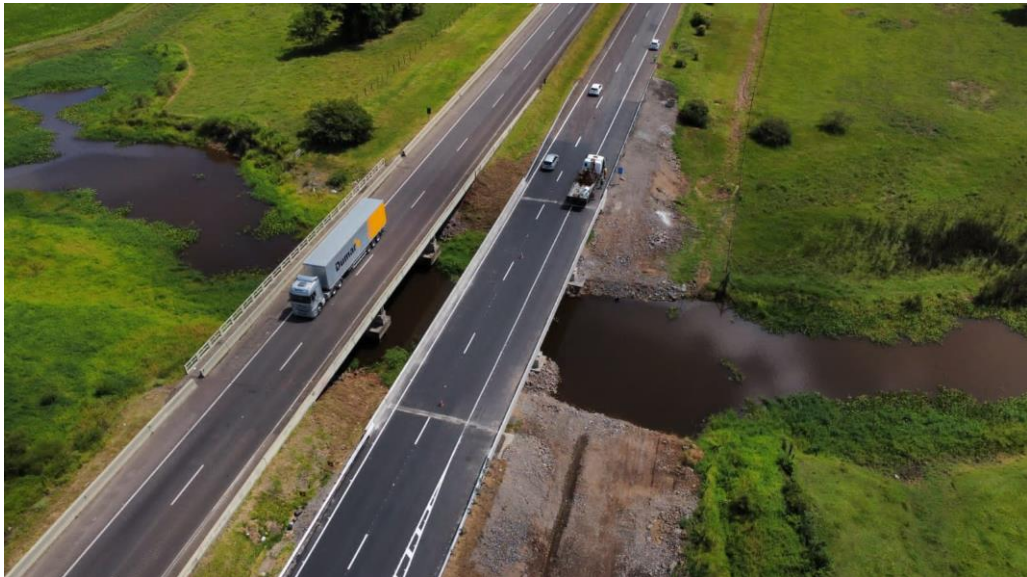
Vista aérea BR101 km 052+930N.