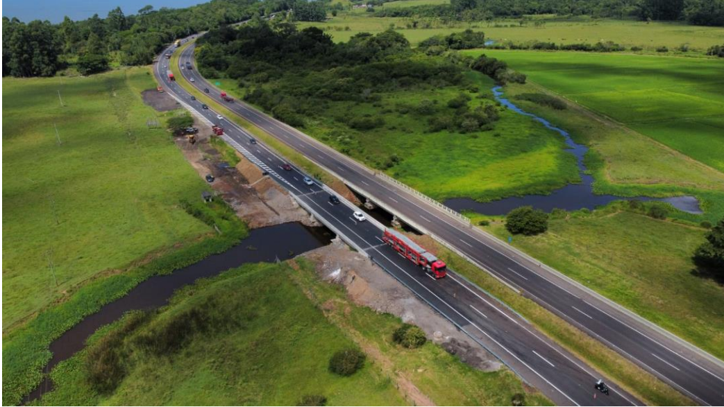
Vista aérea BR101 km 052+930N.