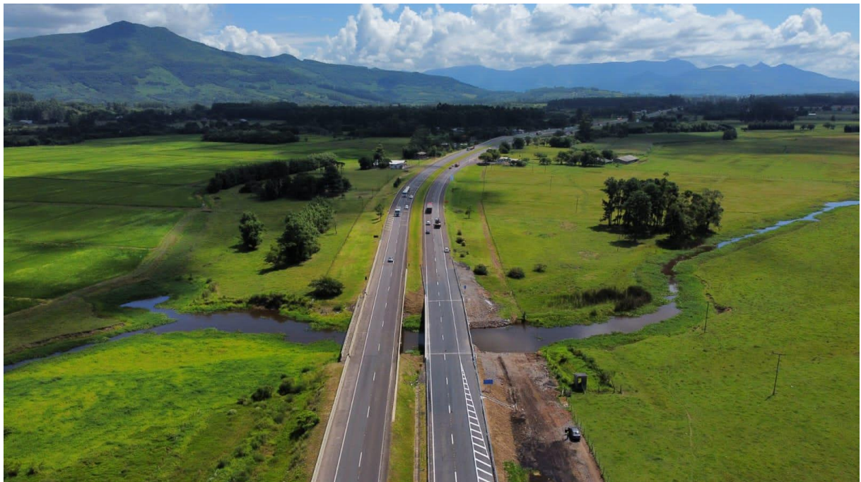
Figura 4 – Localização da obra