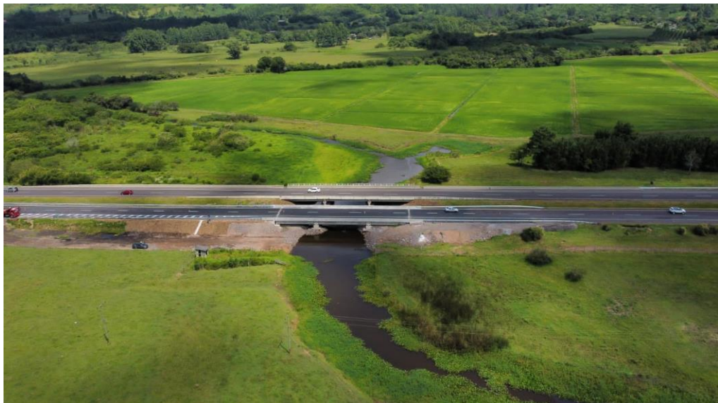
BR 101 km 052+930 N.