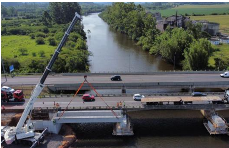
Içamento das vigas BR 101-km 000+000.