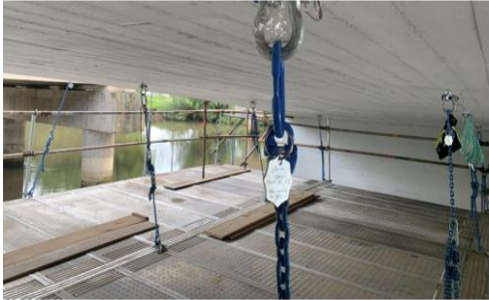
Vista recuperação OAE vão 2 BR 101-km 000+000.