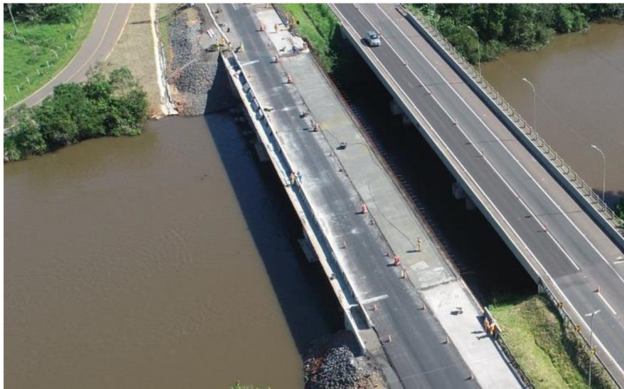
Vista aérea da OAE BR 101-km 000+000.