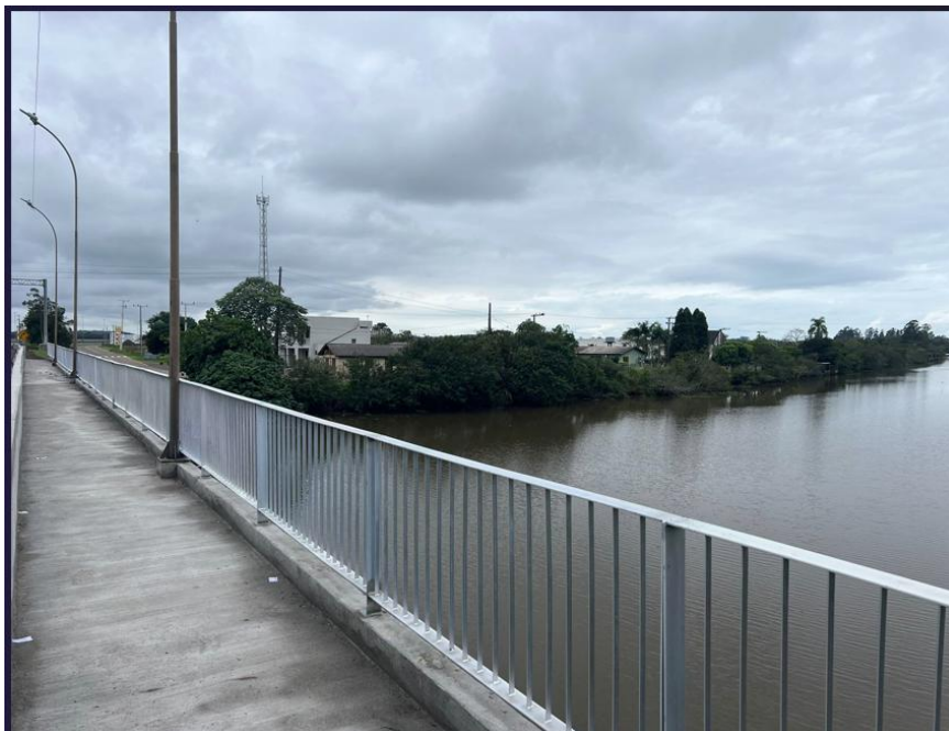
Vista lateral do guarda corpo BR 101-km 000+000.