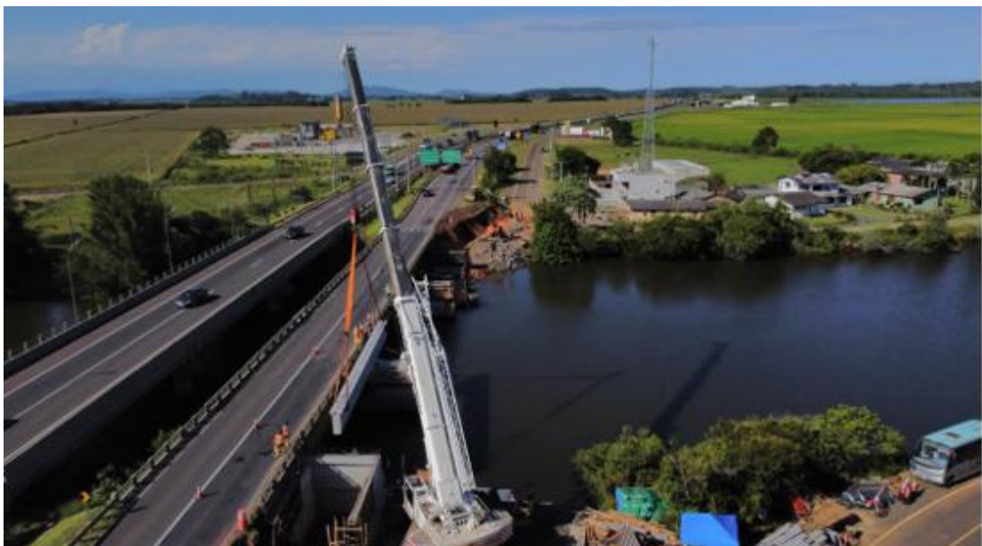
Figura 4 – Localização da obra