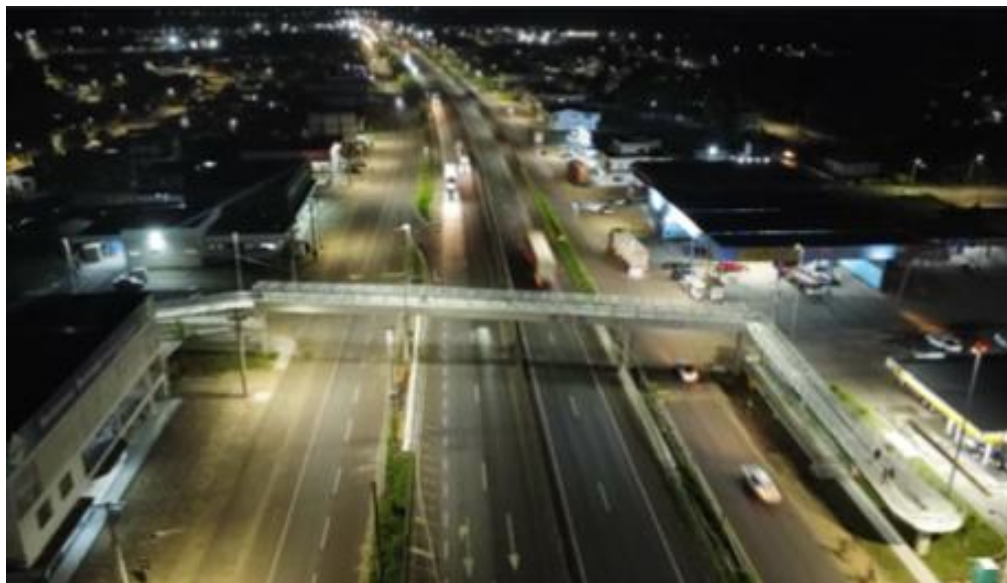
Vista geral da interconexão tipo Trombeta km 023+750.