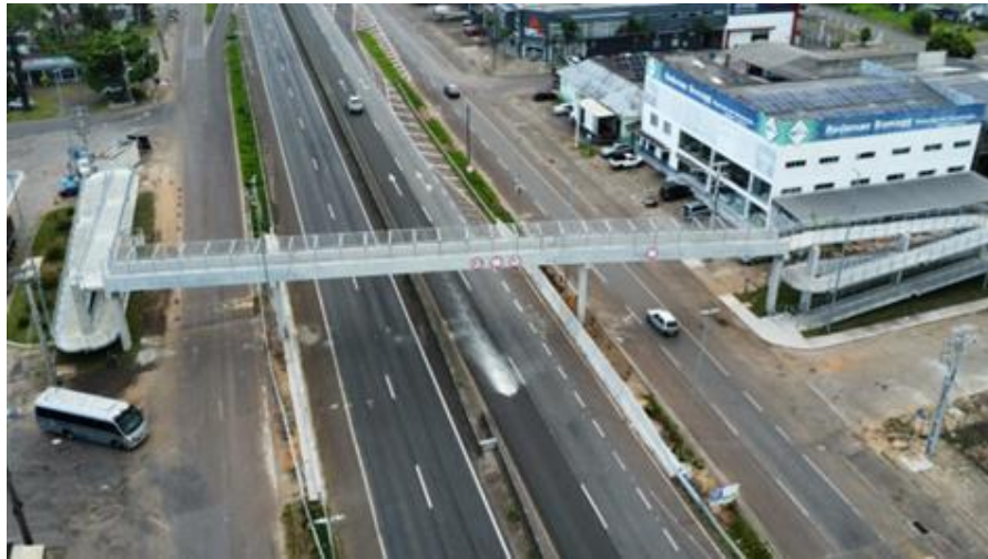
Vista geral da interconexão tipo Trombeta km 023+750.