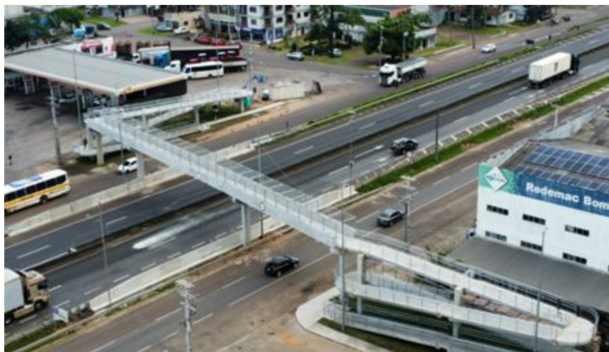
Figura 4 – Localização da obra