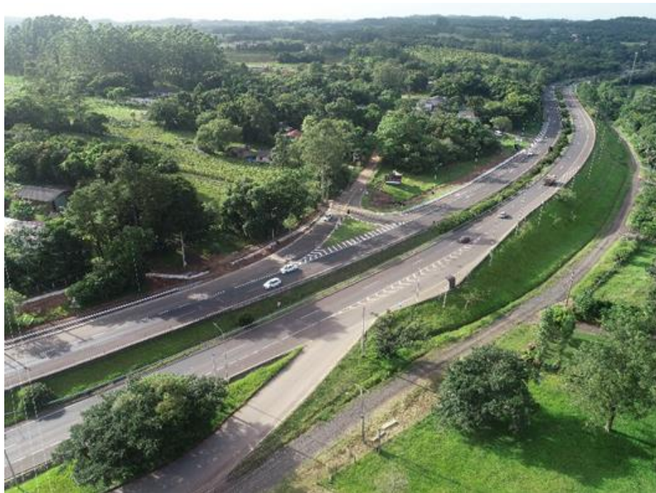
Figura 4 – Localização da obra