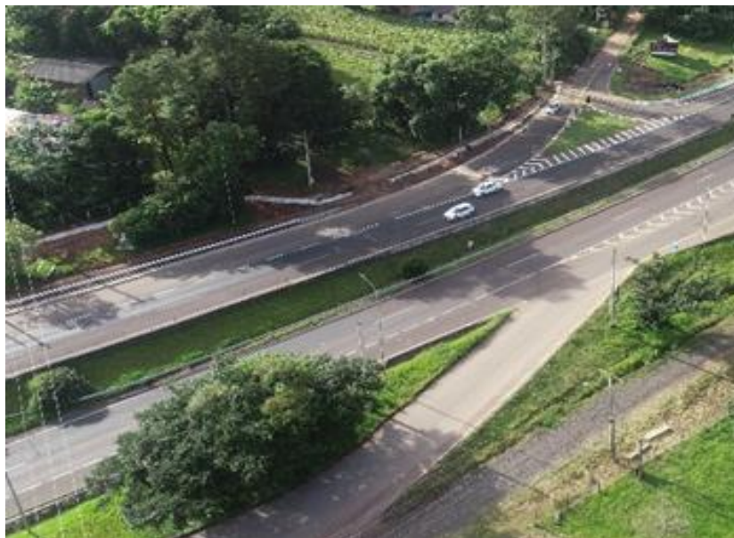
Vista geral da Melhoria em acesso BR 101/RS-km 004+100 LE.