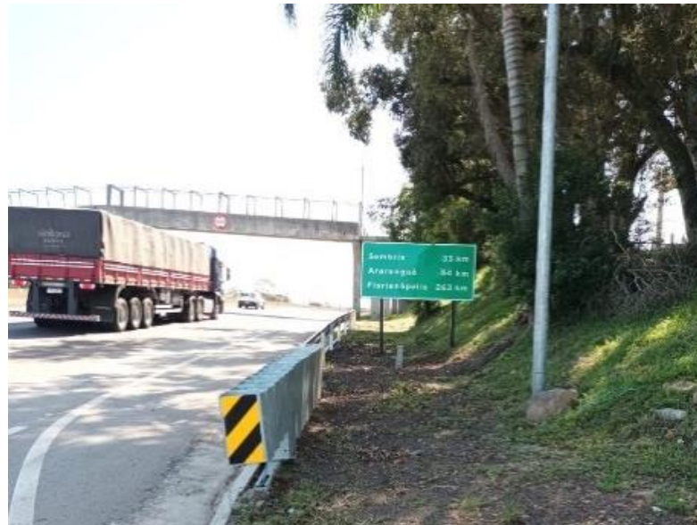
Vista geral da Melhoria em acesso BR 101/RS-km 004+100 LE.