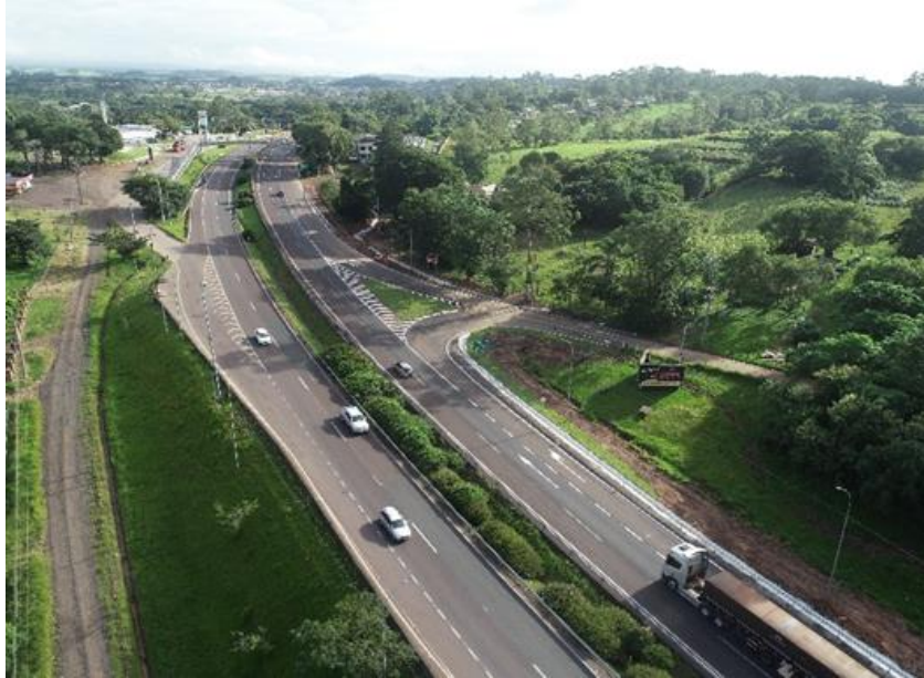
Vista geral da Melhoria em acesso BR 101/RS-km 004+100 LE.