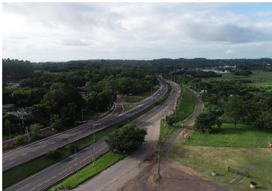
Vista geral da Melhoria em acesso BR 101/RS-km 004+100 LE.