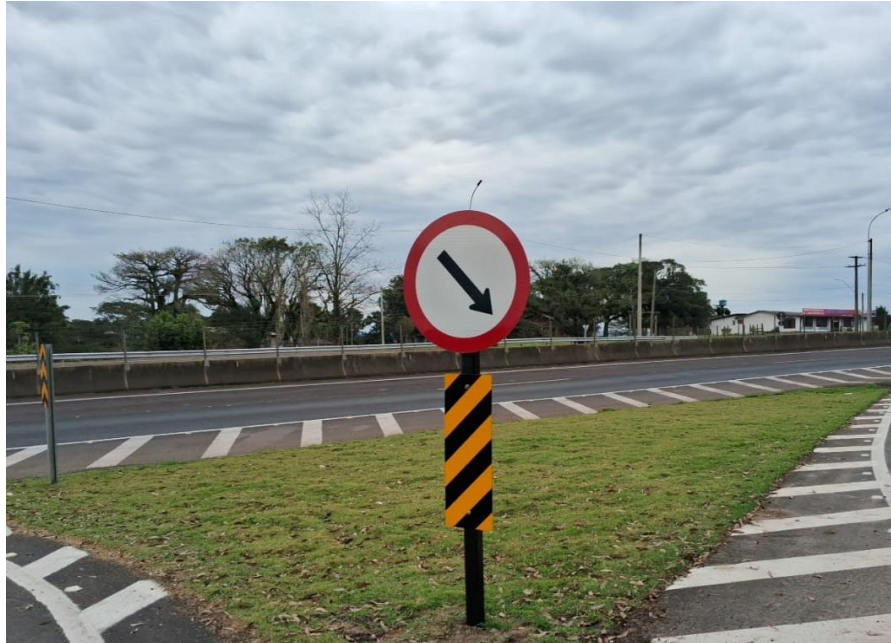
Vista geral da Melhoria em acesso BR 101/RS-km 004+100 LE.