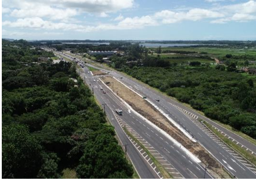
Vista geral da Melhoria em acesso BR 101/RS km 086+240.