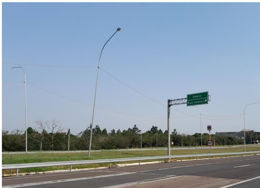
Vista geral da Melhoria em acesso BR 101/RS km 086+240.