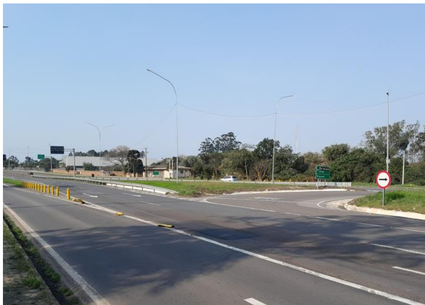
Vista geral da Melhoria em acesso BR 101/RS km 086+240.