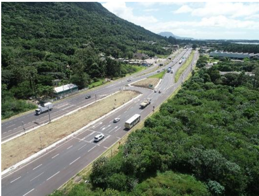
Vista geral da Melhoria em acesso BR 101/RS km 086+240.