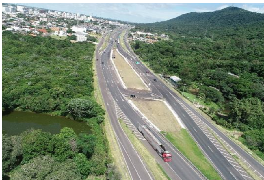
Vista geral da Melhoria em acesso BR 101/RS km 086+240.