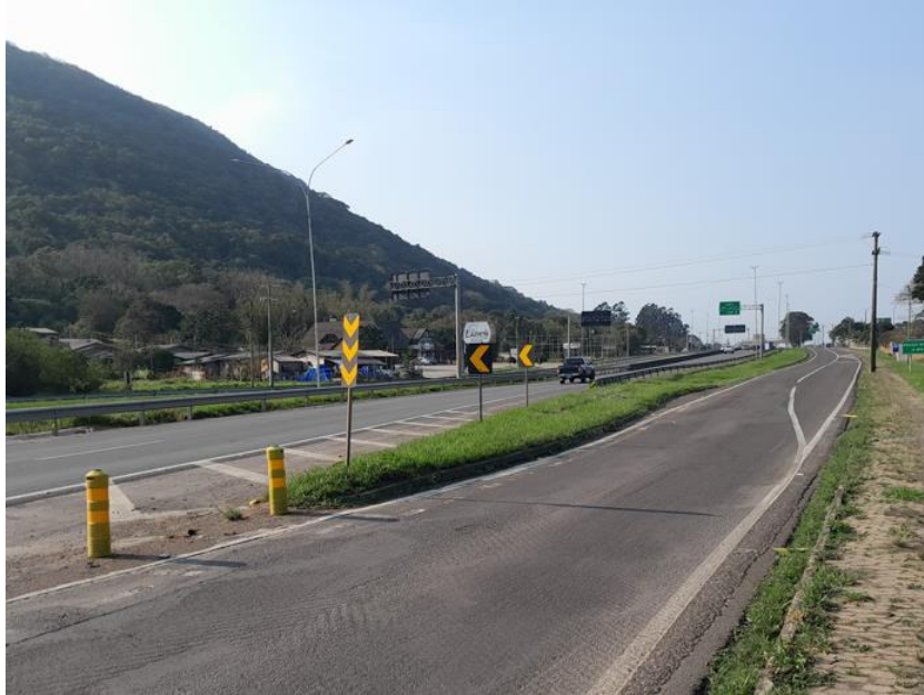
Vista geral da Melhoria em acesso BR 101/RS km 086+240.