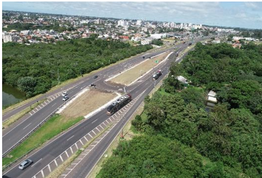
Figura 4 – Localização da obra