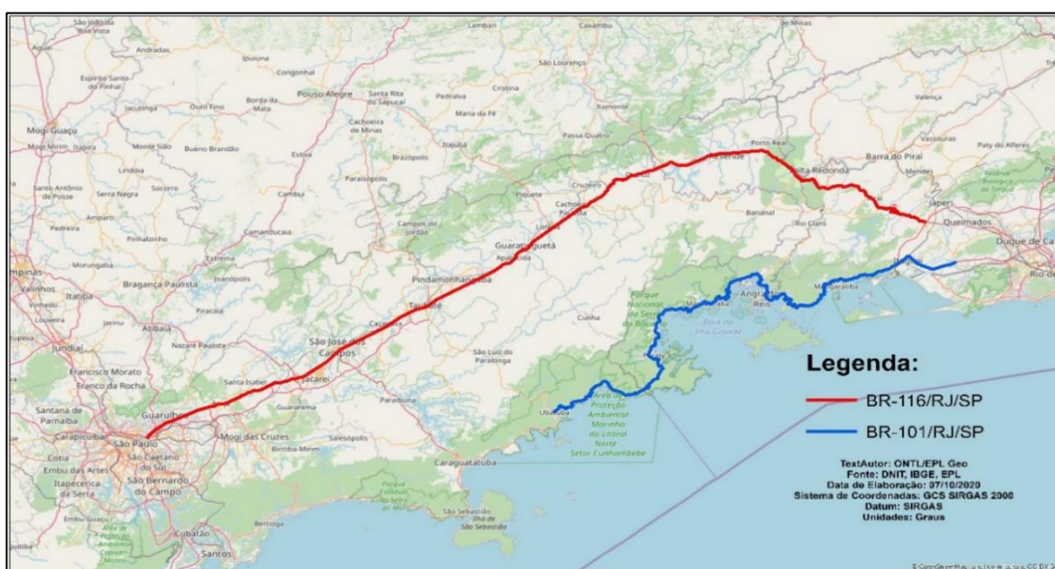
Figura 2 – Mapa do Sistema Rodoviário da Concessão