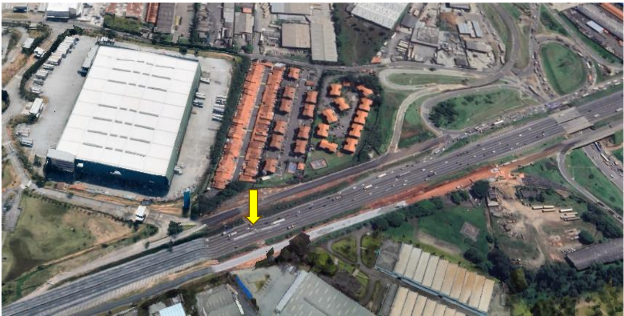
Figura 4 – Localização da obra