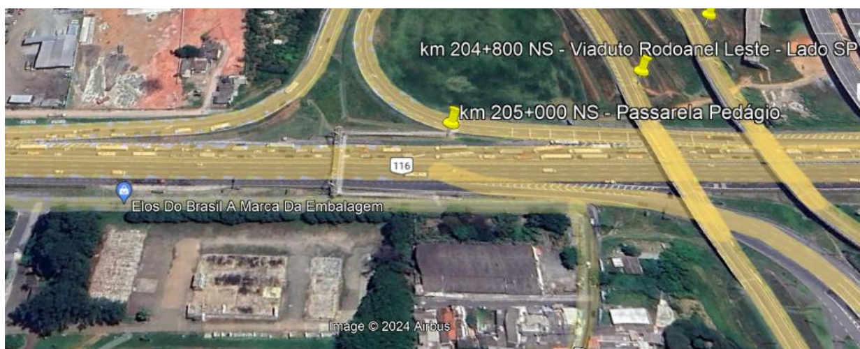
Figura 4 – Localização da obra