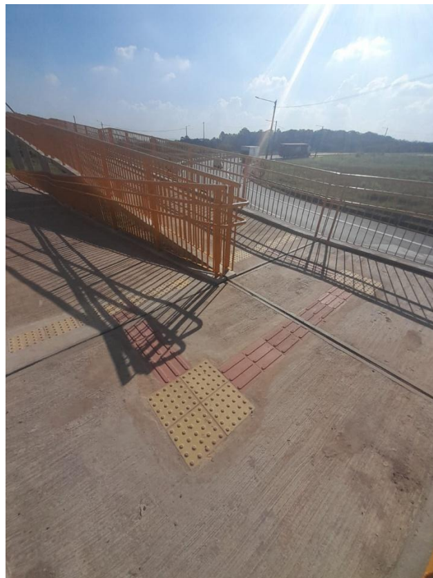
Acessibilidade - Podotátil