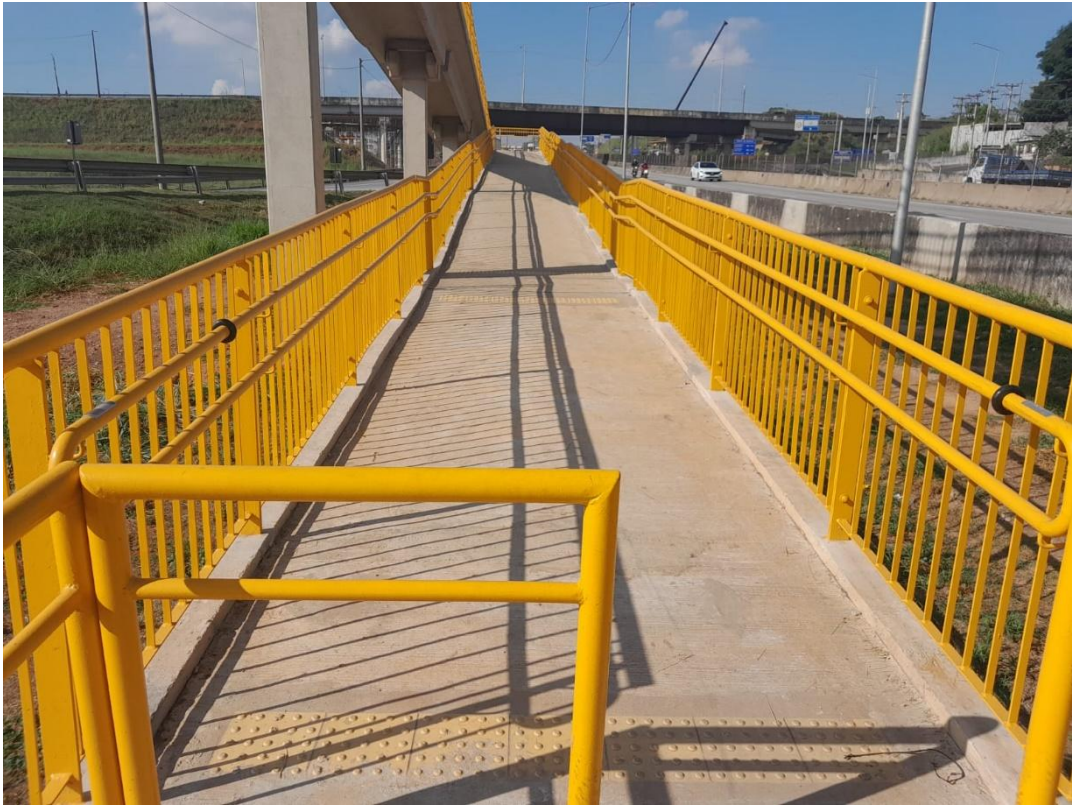
Acessibilidade - Braile