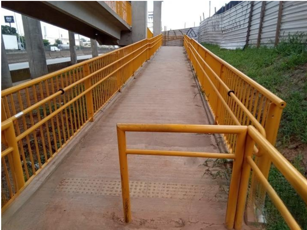
Acessibilidade - Braile