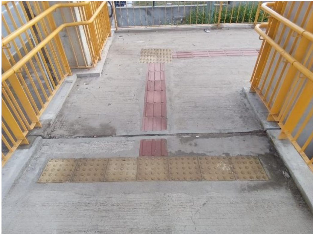
Acessibilidade - Podotátil