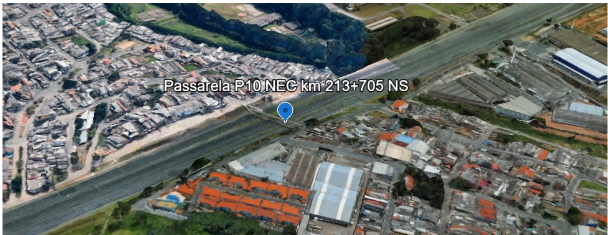
Figura 4 – Localização da obra