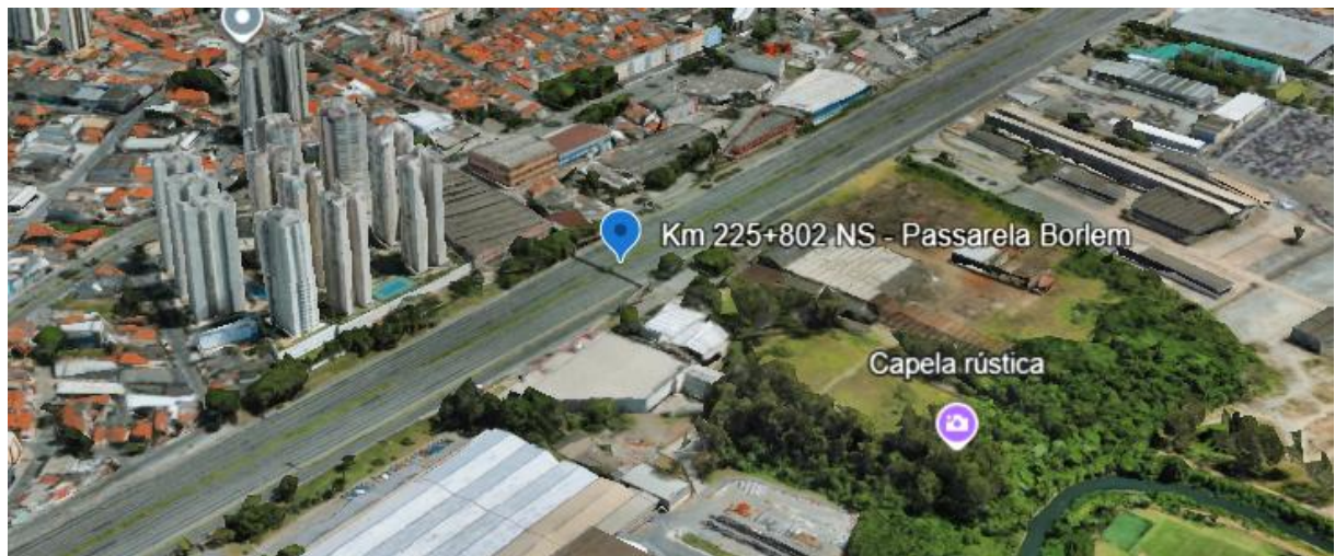
Figura 4 – Localização da obra