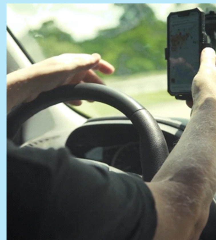
Websérie 'Epidemia da Distração: Quanto vale a vida?', produzida pela CCR em parceria com a agência SuperNormal, reforça o risco de acidentes ao usar o celular enquanto dirige e a falta do uso do cinto de segurança

Os vídeos estão disponíveis nas redes sociais da CCR e também nos canais do Marcelo Tas.