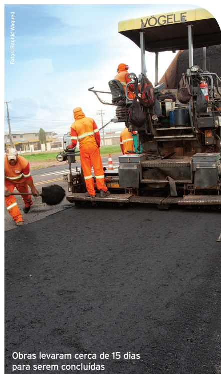
Obras levaram cerca de 15 dias para serem concluídas

o período, a Concessionária instalou sinalização especial no trecho, incluindo Painéis Eletrônicos Móveis de Mensagens Variáveis, para alertar aos motoristas.