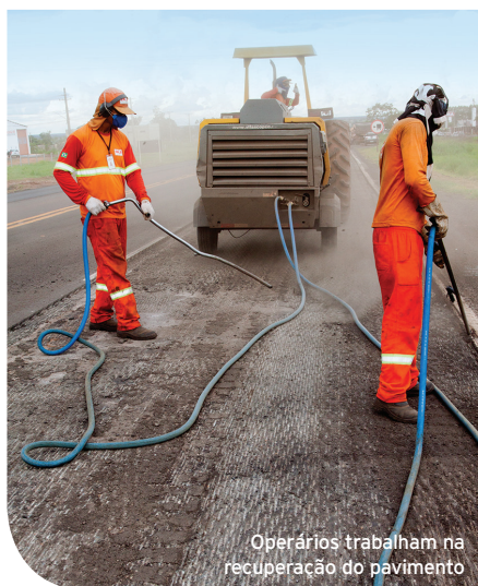
Operários trabalham na recuperação do pavimento

As obras foram necessárias para a melhoria das condições de segurança e fluidez do tráfego na região. Durante